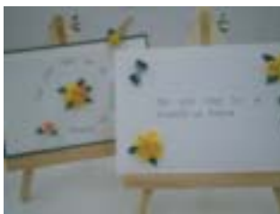
(ペーパークイリングは大島先生をお迎えします。)